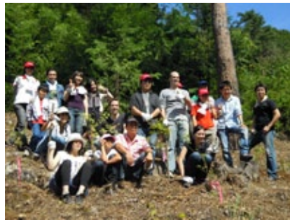
今回の植樹エリアにて