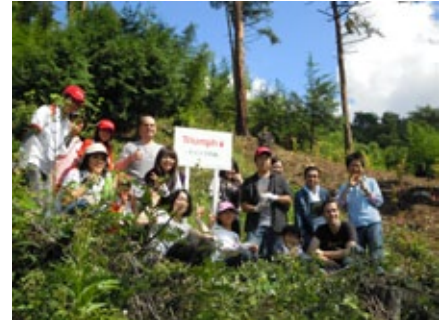
「トリンプの森」看板と共に