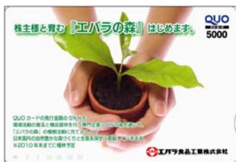
「エバラの森 QUO カード」