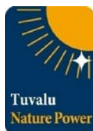
ツバルの森のグリーン電力証書 「ツバル・ネイチャーパワー」

太陽光や風力などのCO2を排出しない自然エネルギーで発電されたグリーン電力は、電力そのものの価値に加えて、CO2を排出しなかった環境価値を併せ持っています。環境価値の部分を取り離し、証書として取引できるようにしたものがグリーン電力証書です。団体や企業は電力会社から購入する電力に加え、グリーン電力証書を組み合わせることで、消費電力が環境にやさしいグリーン電力によるものとみなすことができます。そして、グリーン電力証書の対価が自然エネルギーの発電事業者へ還元されることで、日本国内における自然エネルギーの普及促進、CO2排出削減に貢献することができます。