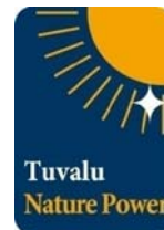
ツバルの森のグリーン電力証書 「ツバルネイチャーパワー」

太陽光などのCO 2 を排出しない自然エネルギーで発電されたグリーン電力は、電力そのものの価値に加えて、CO 2 を排出しなかった環境価値を併せ持っています。環境価値の部分を切り離し、証書として取引できるようにしたものがグリーン電力証書です。団体や企業は電力会社から購入する電力に加え、グリーン電力証書を組み合わせることで、消費電力が環境にやさしいグリーン電力によるものとみなすことができます。そして、グリーン電力証書の対価が自然エネルギーの発電事業者へ還元されることで、日本国内における自然エネルギーの普及促進、CO 2 排出削減に貢献することができます。